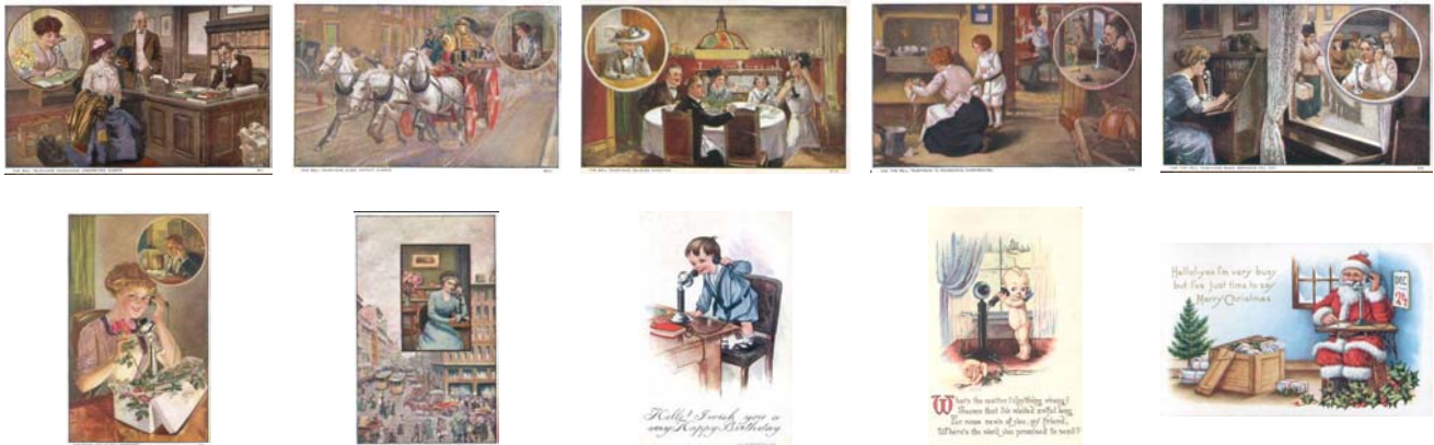
Cartões do início do século XX do acervo da Fundação Telefônica. No jogo Bellatrix , encontram-se dentro do armário, na caixa à esquerda.

Para divulgar os possíveis usos do telefone, a Bell Telephone Co. lançou uma série de cartões postais demonstrando sua utilidade e praticidade como: chamar um bombeiro, agradecimento, notificar atrasos, desejar Feliz Natal, etc.