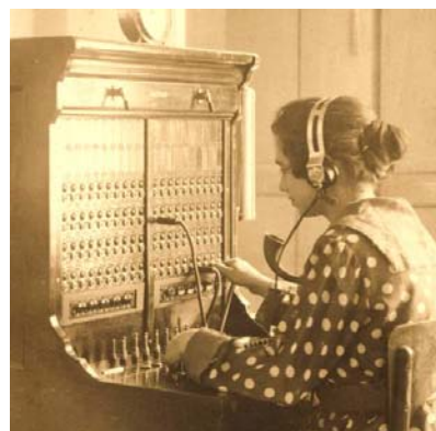
Dispositivo inventado para que as telefonistas tivessem as mãos livres, e aparelho de telefonista no início do século XX